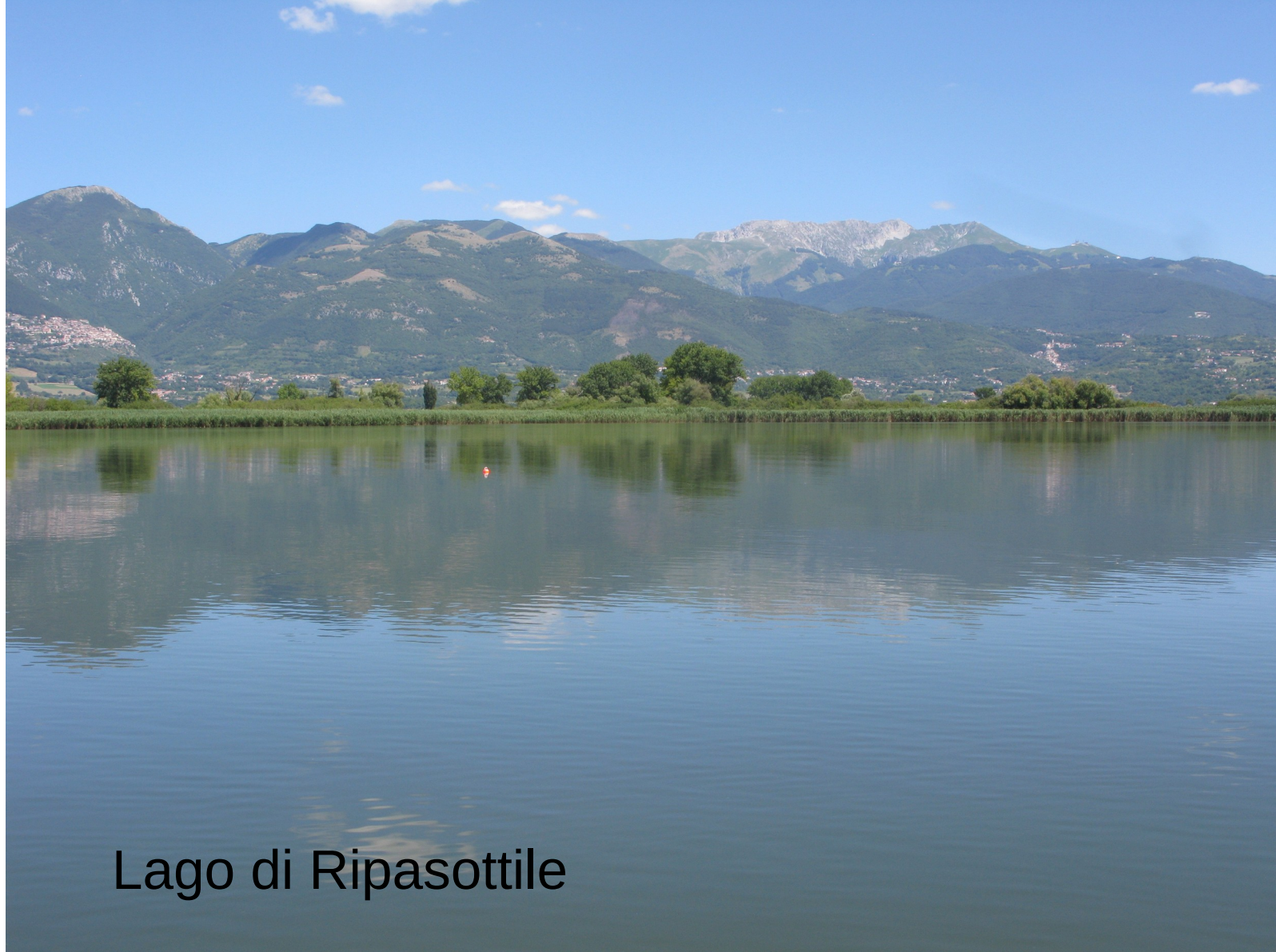
Lago di Ripasottile